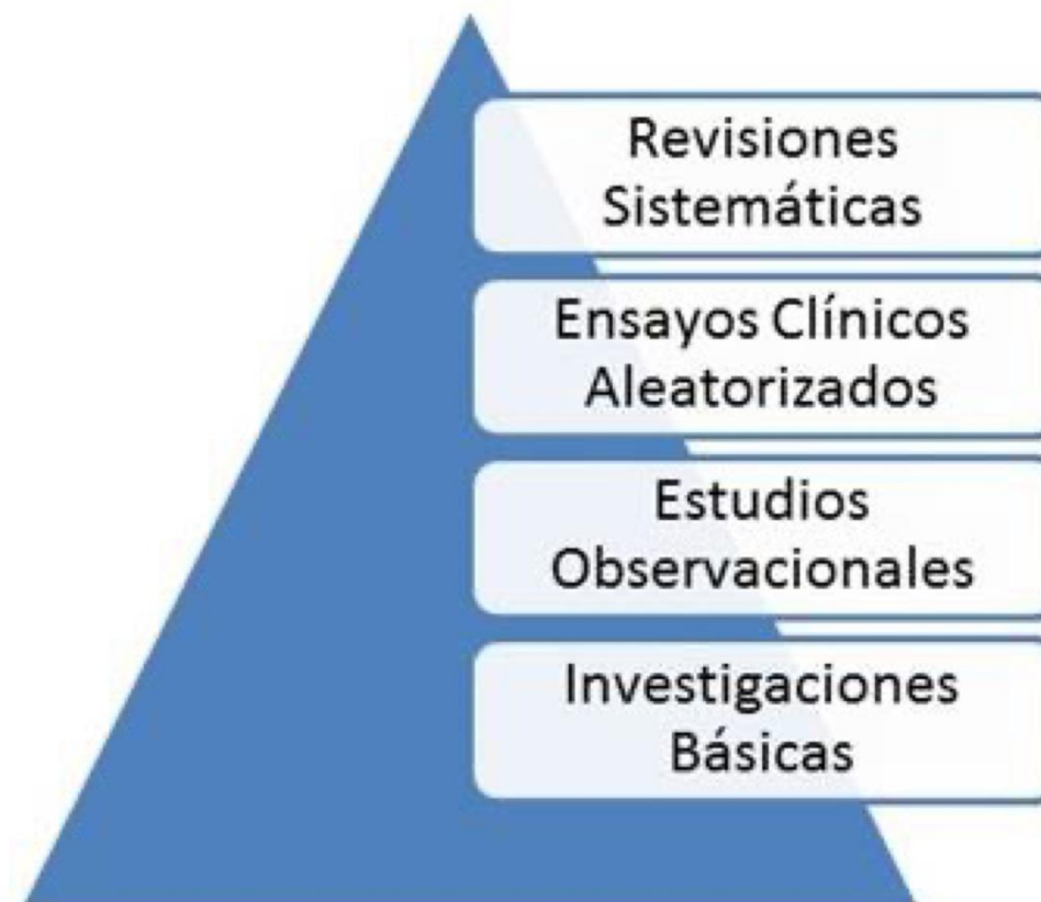
FIGURA 1. Jerarquía de la evidencia.

LA RESPUESTA y TUS CONCLUSIONES ESTARÁN BASADAS EN LA EVIDENCIA